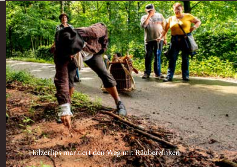
Hölzerlips markiert den Weg mit Räuberzinken