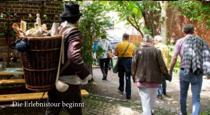
Die Erlebnistour beginnt