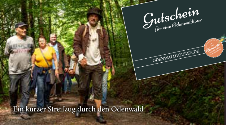
Ein kurzer Streifzug durch den Odenwald