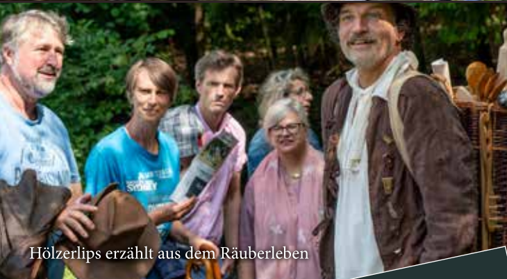
Hölzerlips erzählt aus dem Räuberleben