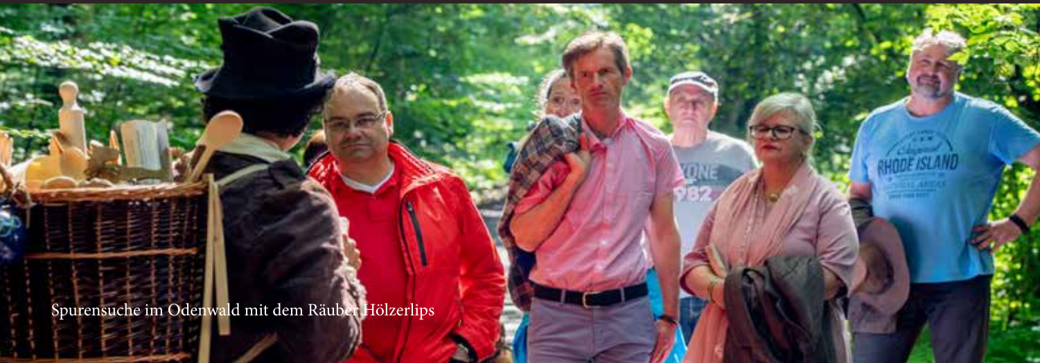
Spurensuche im Odenwald mit dem Räuber Hölzerlips